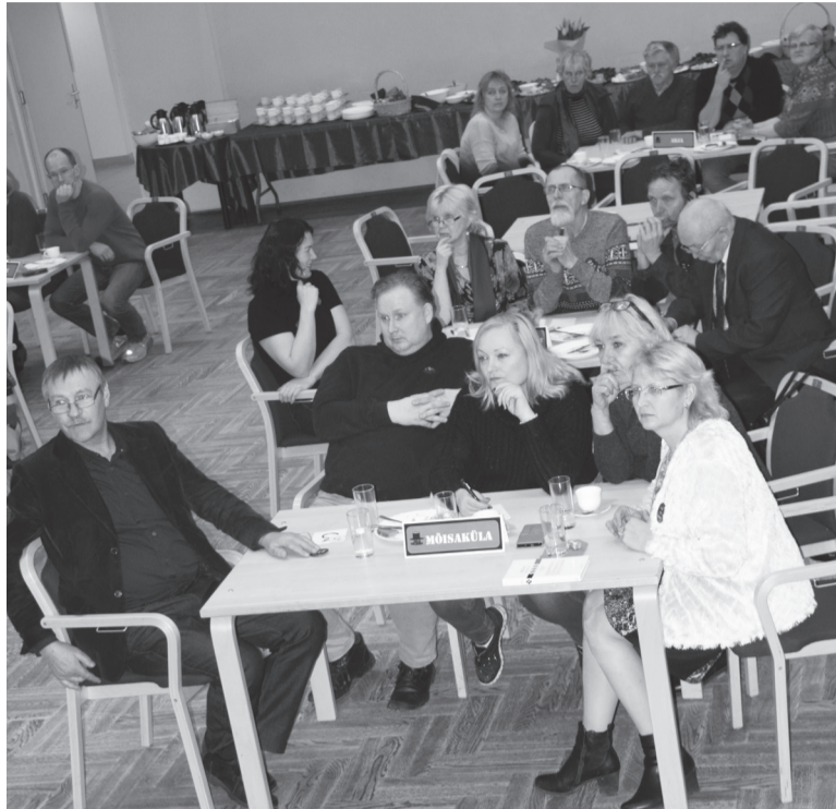
Viimätsel Mulgi mälumängul olli platsin 14 punti. Päeväpildi pääl jäive Mõisaküla, Võrtsu Veerest ja Abia.