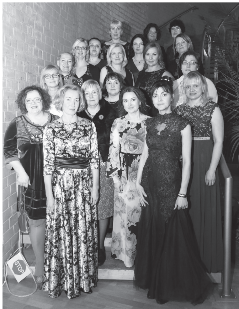
LC Tõrva Mari 23. veebruaril 2017 Valgan maavanembe vastuvõtul. Piit: Ülav Neumann