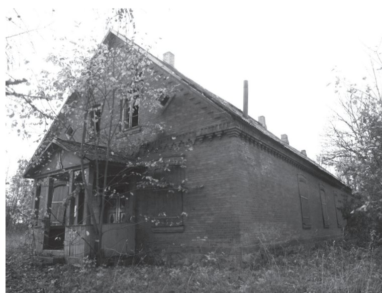
Enne remonti olli leerimaja nii siist ku välläst peris lagunu.