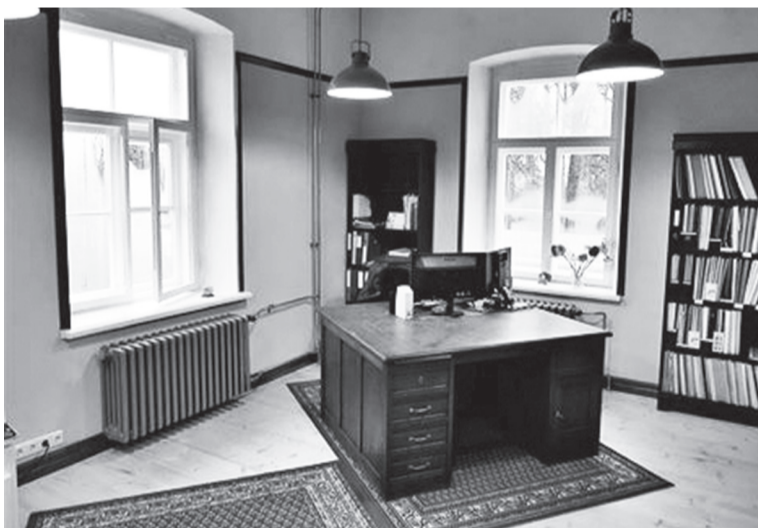
Uvves ja ilusas tettu majan saive omale kotusse Alliste vallamaja, raamatukogu ja kogudus.