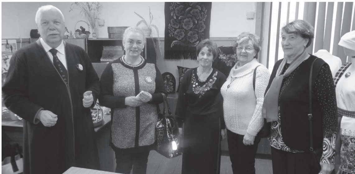
Uku välläpanekul Mulgi Ukuvaka kambren saive kokku vana söbra ja tullive miilde ammutse mustre.